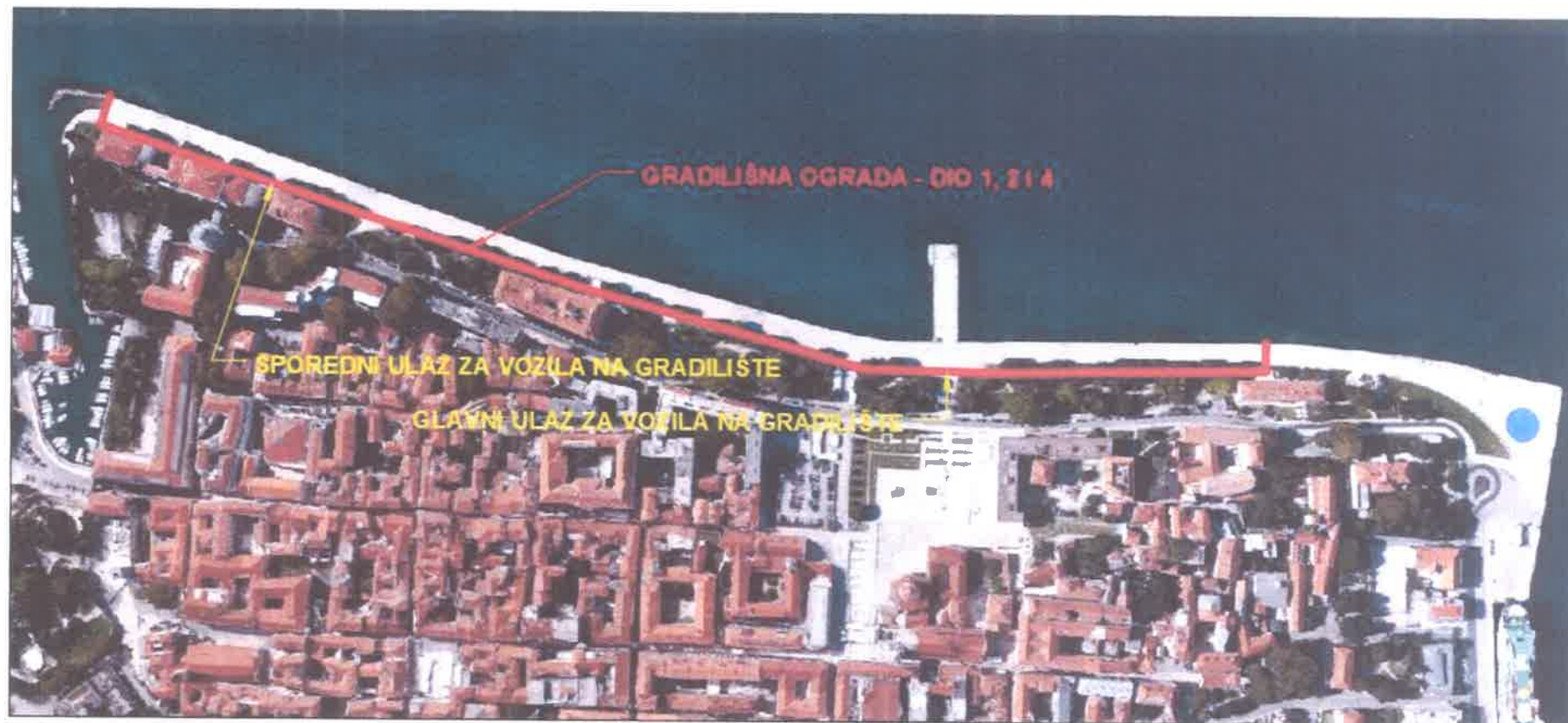
Prilog 4 – Grafički prikaz gradilišta i korištenih površina