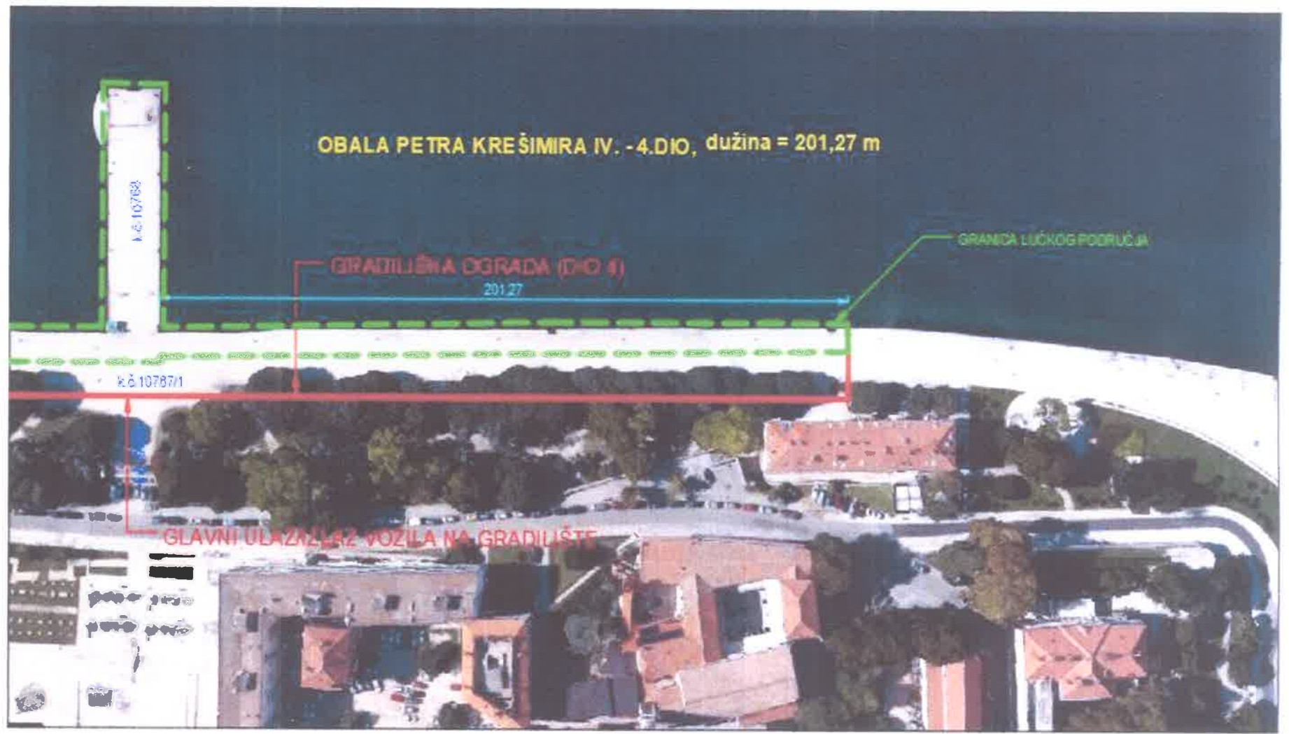
Prilog 1 – Grafički prikaz (dio 4)