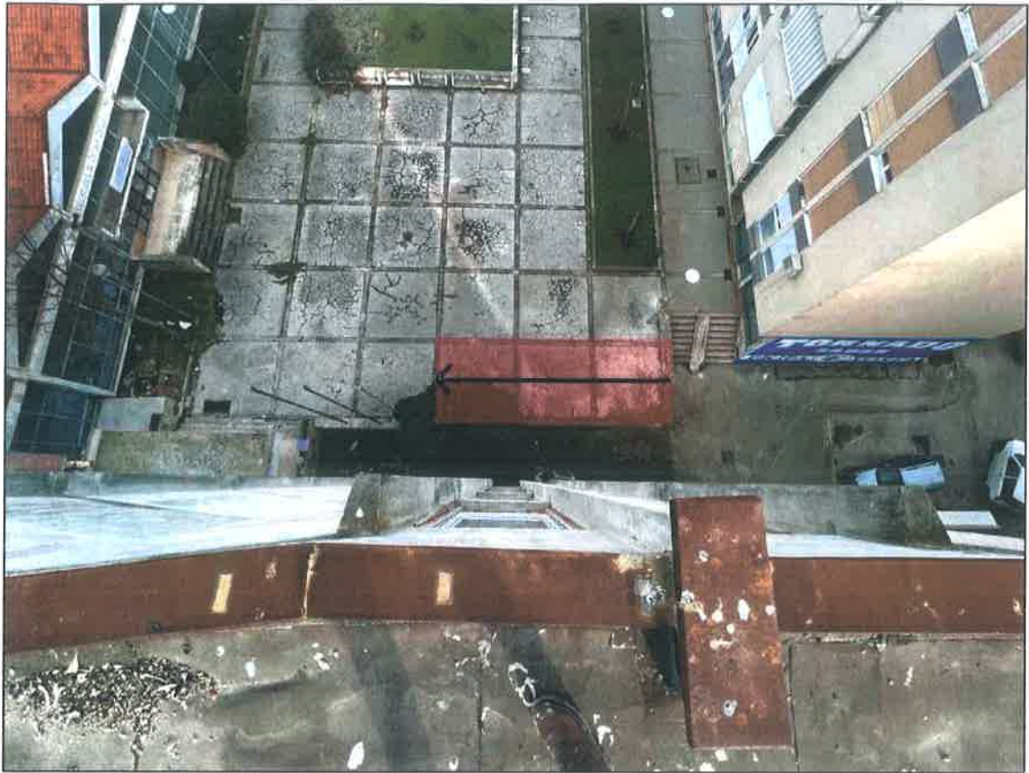
TLOCRTNI POGLED RAMPE