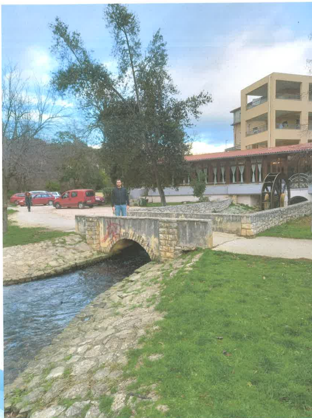
Slika 8. Lokacija 2A

Jedan senzor za mjerenje protoka, brzine i vodostaja postavlja se na mostić ispred restorana Ankora (Slika 5 (2A), Slika 8) i mjeri protok, brzinu i vodostaj iz stalnog izvora Vruljica. Ovaj izvor je aktivan i u ljetnim mjesecima, a tijekom jakih kiša može imati značajne protoke. Drugi senzor se postavlja na donjem mostiću (Slika 5 (2B), Slika 9) u svrhu mjerenja dotoka s cijelog sliva uzvodno od Vruljice. Treći senzor se postavlja na gornjem mostiću (Slika 5 (2C), Slika 10), kako bi se izmaknuo izvan zone utjecaja uspora mora.