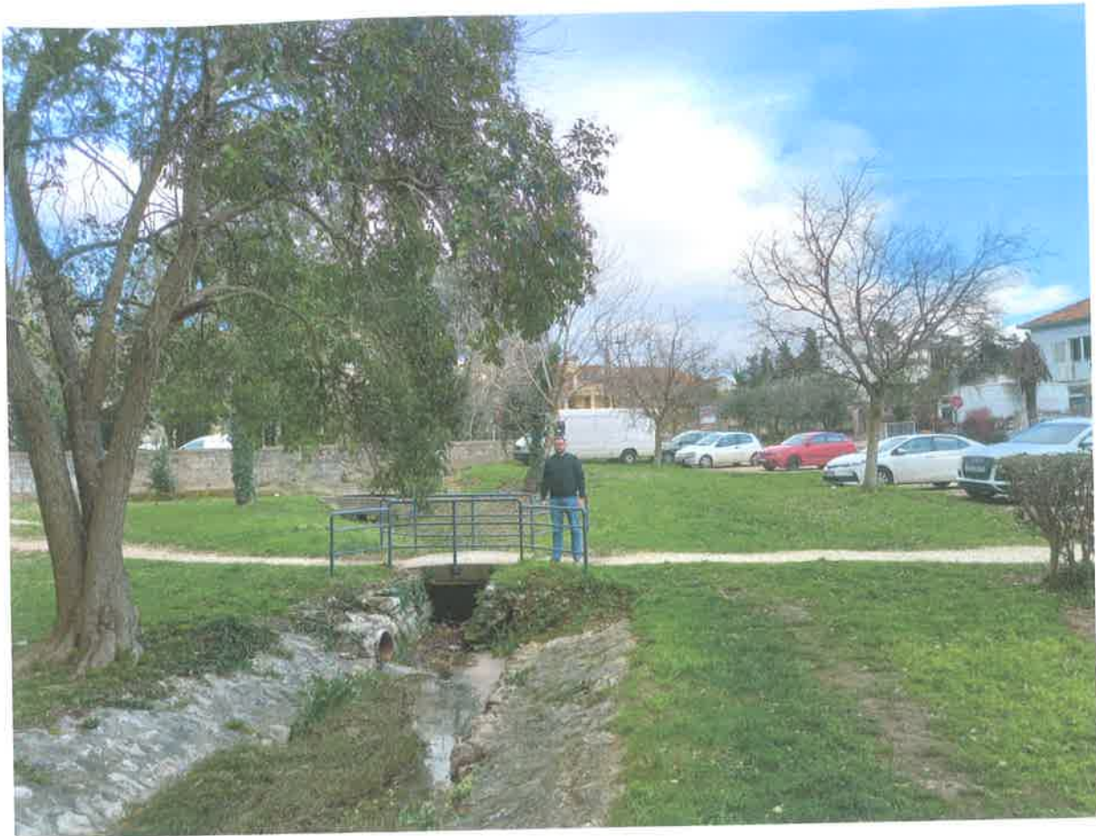
Slika 10. Lokacija 2C