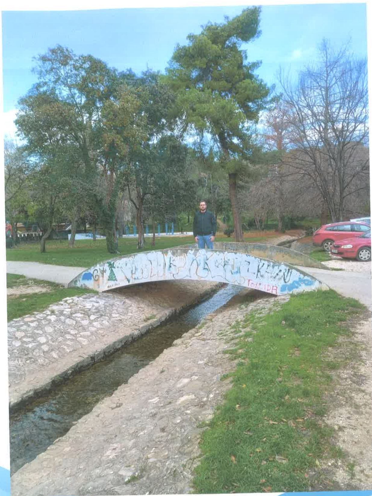
Slika 9. Lokacija 2B