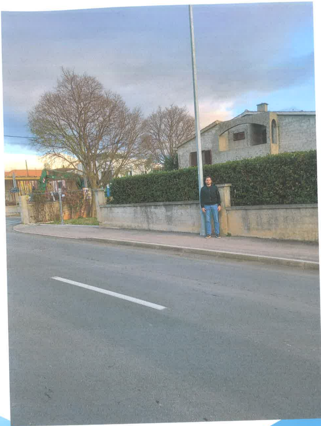
Slika 12. Lokacija 3B