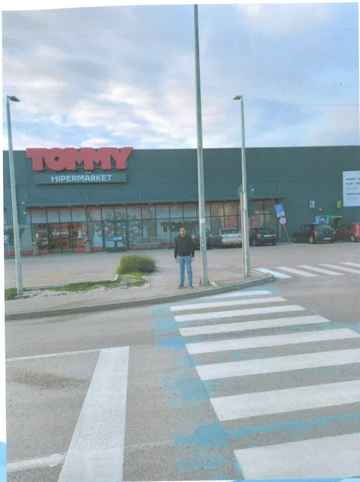
Slika 11. Lokacija 3A

Jedna kamera za brojanje automobila se postavlja na rasvjetni stup ispred hipermarketa Tommy na Putu Bokanjca (Slika 5 (3A), Slika 11), a druga na križanju ulica Nikole Tesle i Ražanačke (Slika 5 (3B), Slika 12).