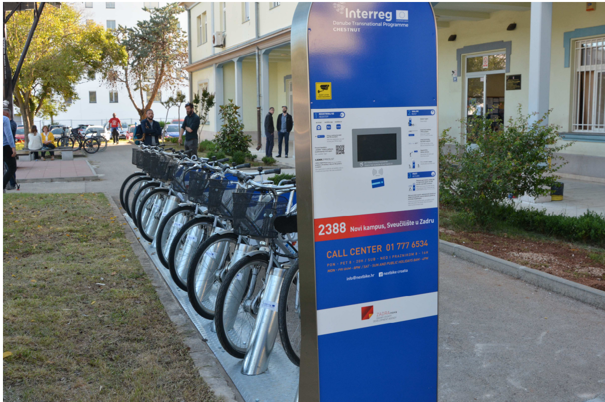
Slika 4: Sustav električnih i klasičnih bicikala