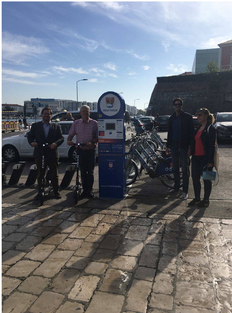
Slika 3: Sustav električnih romobila