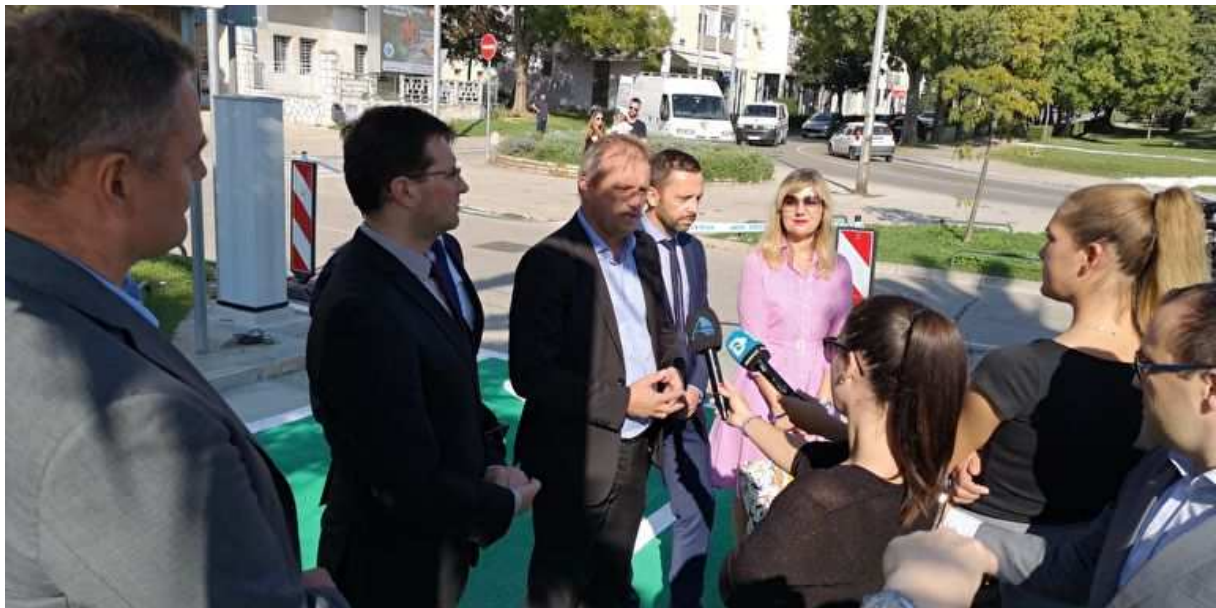
Slika 2: Otvorenje punionice elektromotornih vozila