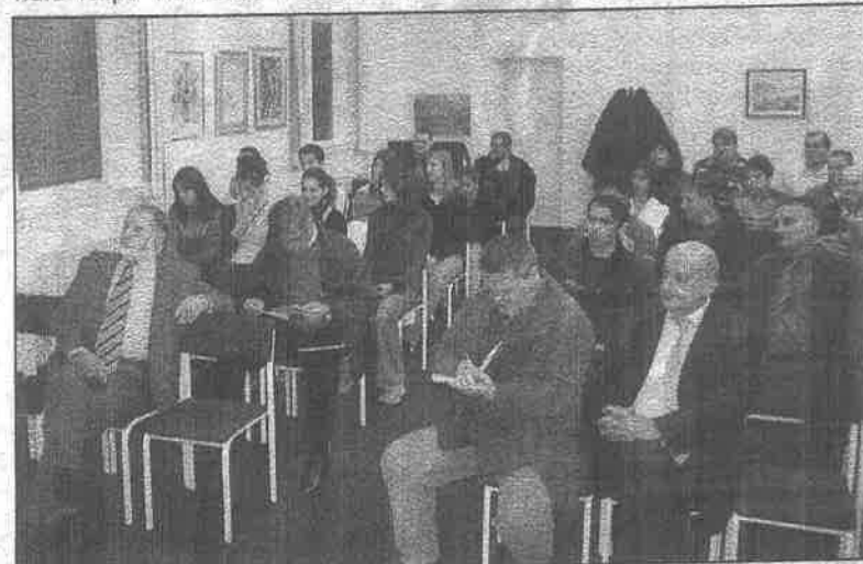
Na svečanoj dodjeli priznanja najuspješnijima moglo se čuti "puno lipih stvari"

niora, tada je logično da trofejni AAŠK Zadar dobije priznanje. Od te 23 medalje 12 je zlatnih, četiri srebrne te sedam brončanog sjaja. Sjajan uspjeh za mlade zadarske atletičare s obzirom na (ne)uvjete u kojima rade pri čemu još uvijek možete brojiti rupe gdje su "lupa-