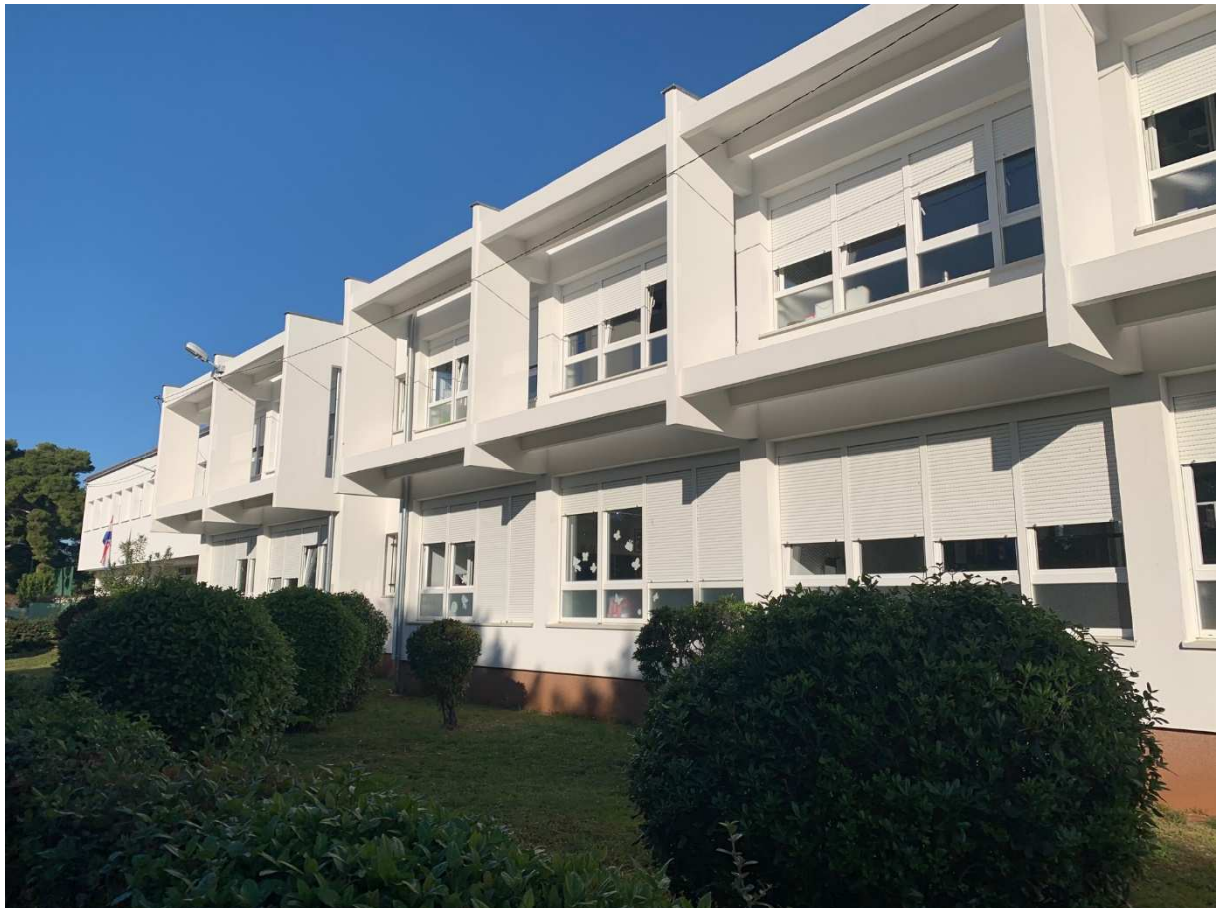
Slika 2: Energetske obnovljena OŠ Smiljevac

Radovi na energetskej obnovi Osnovne škole Smiljevac obuhvaćali su provedbu mjera povećanja toplinske zaštite vanjske ovojnice, zamjene dotrajale stolarije energetske učinkovito, toplinske izolacije ravnih i kosih krovova, unapređenja sustava grijanja (prelazak s ekstra lakog loživog ulja na prirodni plin), rekonstrukcije električne instalacije kotlovnice i ugradnje digitalne regulacije te zamjene unutarnje rasvjete energetske učinkovito.