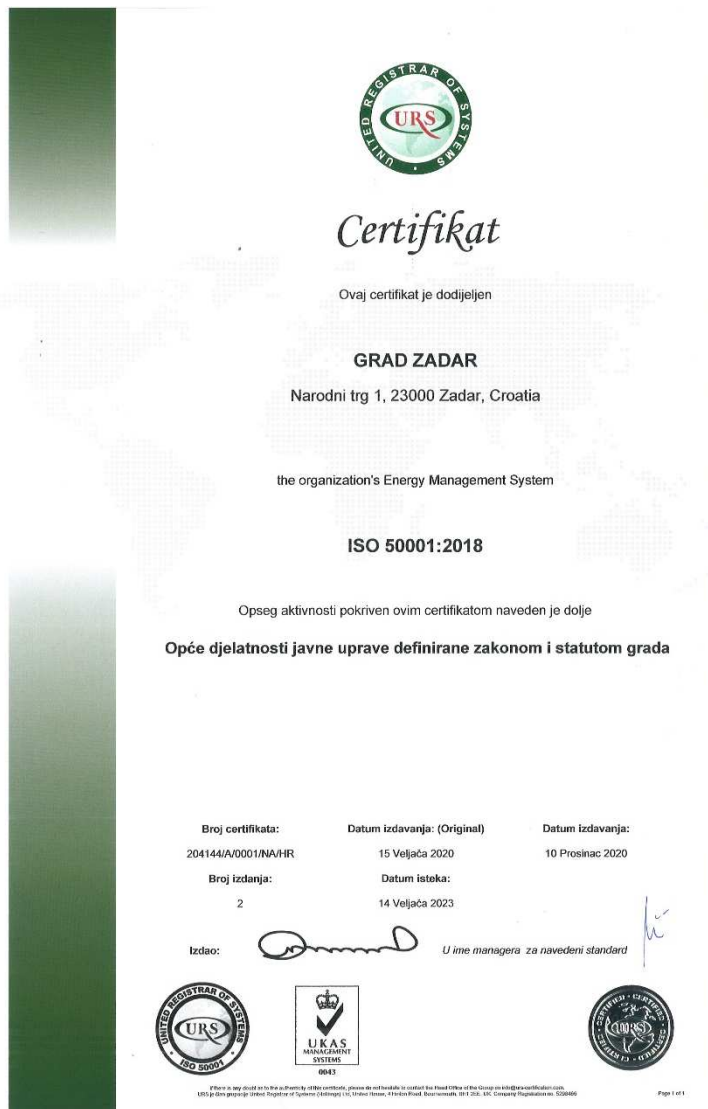
Slika 3: ISO 5001:2018 certifikat za zgradu Grada Zadra