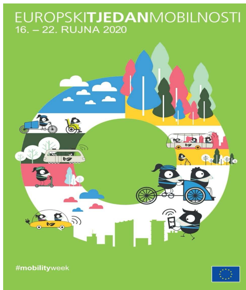
Slika 4: Plakat Europskog tjedna mobilnosti Grada Zadra

U periodu od 16. do 22. rujna 2020. godine Grad Zadar je u sklopu održavanja Europskog tjedna mobilnosti organizirao besplatnu vožnju javnim gradskim biciklima za sve građane. Europski tjedan mobilnosti održavao se pod sloganom „Mobilnost s nultim emisijama za sve“.