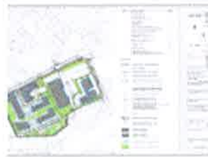
4. UVJETI GRADNJE