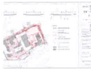
2A. PROMETNI SUSTAV