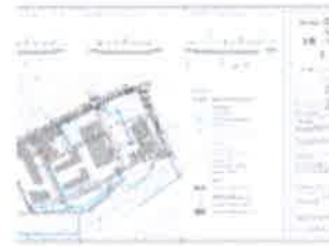
2B. VODNOGOSPODARSKI SUSTAV