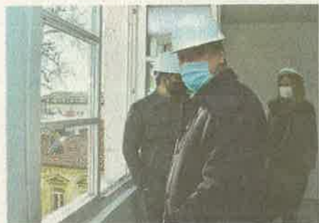
Zadovoljni dinamikom radova