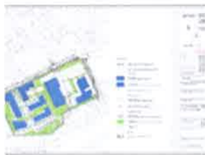
3. UVJETI KORIŠTENJA, UREĐENJA I ZAŠTITE POVRŠINA