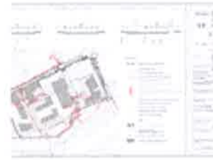
2C. ENERGETSKI SUSTAV I EKI