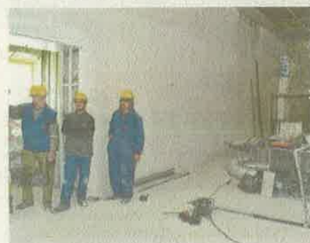
U palači se radi punom parom