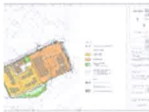
1. DETALJNA NAMJENA POVRŠINA