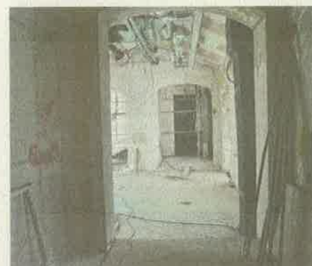
Postavljaju se instalacije

se lošije od očekivanog, no sada smo u završnoj fazi i do svibnja bi sve trebalo biti gotovo, objasnio je Podčič dodavši da će Providurova palača biti povezana s Kneževom palačom, zajedno će činiti jednu funkcionalnu cjelinu te će se sadržaji međusobno povezivati i izmjenjivati.