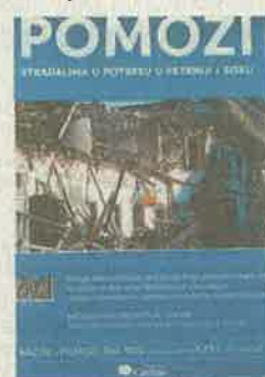
Plakat ovogodišnje korizmene akcije

župnici u crkve postavljaju posebne kutije milodara za akciju te u korizmenim aktiv-