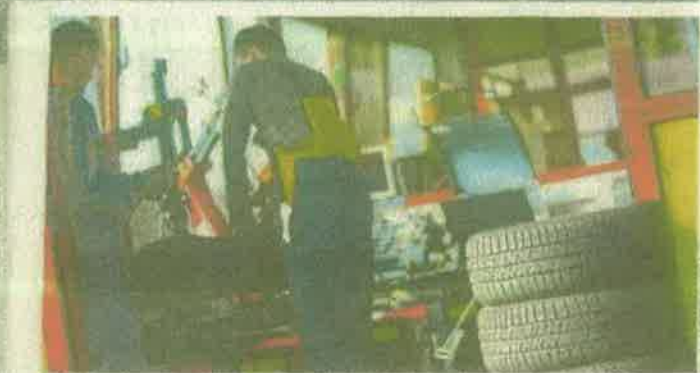
Orbit dana vulkanizeri imaju pune ruke posla

I u slučaju da vozač upravlja vozilom koje nije opremljeno od snijega ili leda.