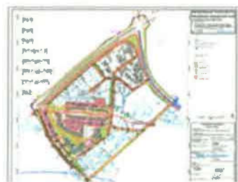
2A. PROMETNA INFRASTRUKTURA