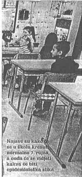
Najave su kako će se u školama krenuti normalno 7. rujna, a onda će se vidjeti kakva će biti epidemiološka slika