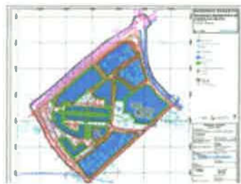
4. NAČIN I UVJETI GRADNJE