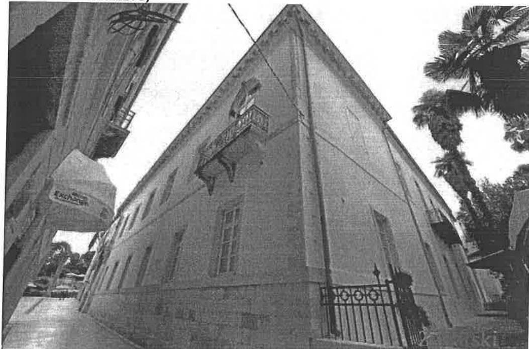
Kneževa palača svoja vrata otvara i maškarama

Na salsa karnevalu koji će se održati u utork 13. 2. 2018. u Kneževoj palači uz vrhunske latin jazz glazbenike iz banda Salsa Sandunga, birat će se najbolja maska!