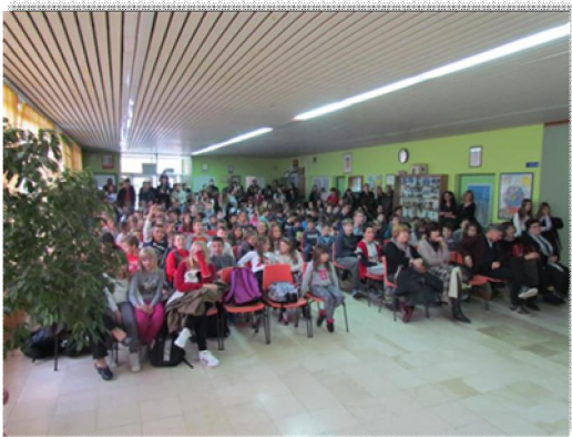
U OŠ Stanovi obnovljen je interijer

U školskoj 2014./2015. godini osnovne škole Grada Zadra pohađala su 6.734 učenika u 336 razrednih odjela, a u školskoj 2015./2016. godini 6.752 učenika u 340 razredna odjela.