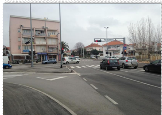
Rekonstruirani Put Stanova

Na području komunalnih djelatnosti u izvještajnom razdoblju provodili su se poslovi na održavanju sustava odvodnje atmosferskih voda, održavanje čistoće javnih površina i uređenja zelenih javnih površina, sukladno programima. Pri poslovima