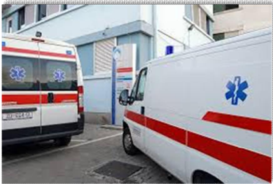
Turistički tim Hitne medicinske pomoći

Usprkos financijskoj krizi uspješno se realiziraju preuzete obveze prema zdravstvenim ustanovama koje djeluju na području grada Zadra.