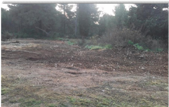
Sanirano divlje odlagalište otpada na lokaciji Vrh Skročini

U skladu s planom provedbe projekta GEF (Global Environment Facility-Globalni fond za okoliš) putem kojeg se osiguravaju bespovratna sredstva za financiranje izrade dokumentacije za sanaciju i zatvaranje odlagališta otpada Diklo, u kolovozu 2015. dobivena je Lokacijska informacija za zemljište u obuhvatu odlagališta što predstavlja osnovu za daljnje projektiranje, i to izradu studije izvodljivosti s analizom koristi i troškova, zahtjevima zaposlenika, idejnog projekta s lokacijskom dozvolom te aplikacije za prijavu za EU financiranje radova na sanaciji odlagališta Diklo s obradom procjednih voda, izrade studije procjene utjecaja na okoliš s javnom raspravom, uključujući istražne radove i monitoring na odlagalištu Diklo. U drugoj polovici 2015. godine rješavana je