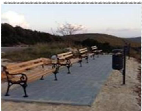
Uređeni vidikovac na otoku Molatu

Temeljem prijave Grada Zadra, FZOEU je financirao zamjenu radne tvari R22 s alternativnom dopuštenom tvari R407C u ŠC Višnjik. Ovim projektom izvršena je prilagodba četiri postojeća klimatizacijska sustava Športskog centra Višnjik te je izvršena zamjena potrebnih dijelova do postizanja potpune funkcionalnosti sustava.