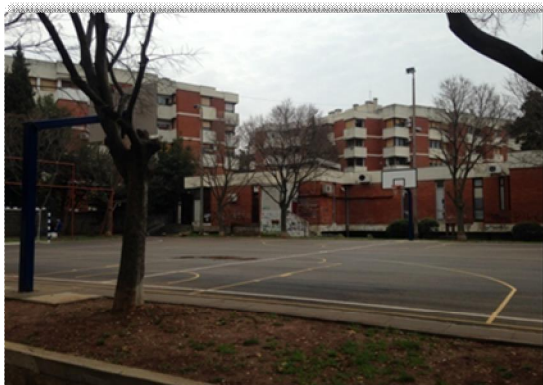
Uređeno sportsko igralište kod Maraska parka

održavanja nerazvrstanih cestanajznačajnija je cjelovita rekonstrukcija kolnika i oborinske odvodnje na dijelu Puta Stanova. Asfaltirano je još 9