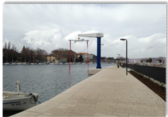
Uređena šetnica na Branimirovoj obali u uvali Jazine

Dovršena je i 1. faza uređenja okoliša u dijelu stambenog naselja Smiljevac u sklopu kojeg se uređuje potrebno parkiralište i zelene javne površine. Do konca 2016. godine dovršavali su se i radovi na uređenju obalnog pojasa uvala Jazine kod ŠRD Zubatac. Tim projektom završena je rekonstrukcija obale, izgrađena šetnica