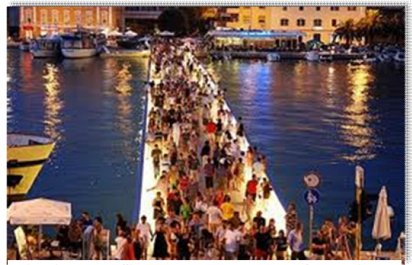
Rekordna turistička sezona s porastom noćenja od 9 %

U ovom izvještajnom razdoblju po prvi put provedena su čak 4 programa poticaja zadarskog poduzetništva koji se odnose na dodjelu direktnih potpora poduzetnicima i obrtnicima. Kroz programe subvencioniranja kamata na kredite poduzetnicima, poticanja poljoprivrede, ribarstva i ruralnog razvoja, potpora tradicijskim i umjetničkim obrtima i poticanja malog gospodarstvadirektnu potporu gospodarstvu ostvarilo je 98 gospodarskih subjekata (poduzetnika, obrtnika i OPG-ova). U navedene gospodarske subjekte nije uračunato 20-ak poduzetnika početnika koji posluju u Poduzetničkom inkubatoru i kojima se subvencionira cijena najma poslovnog prostora.