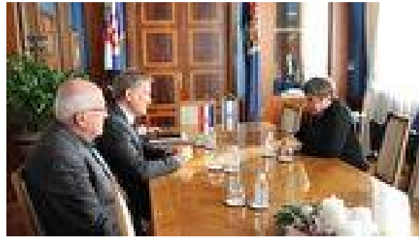
posjet veleposlanice Izraela n.j.e. Zine KalayKleitman

posjet predstavnika institucija ISTORECO iz Reggio Emilije. Povodom blagdana Svih svetih naš grad posjetio je i novi generalni konzul Republike Italije u Rijeci. Također, povodom 30. obljetnice potpisivanja Povelje i prijateljstvu Romansa i Zadra, u suradnji s Hrvatsko-francuskom udrugom Zadar organizirana je prigodna izložba. Organiziran je i