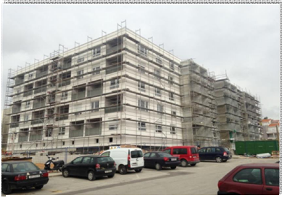
Nova zgrada sa socijalnim stanovima na Crvenim kućama

je ukupno preko 50 posto kućanstava, odnosno preko 70 posto stanovnika Zadra. Ubrzana i sveobuhvatna gradnja sustava odvodnje u mjesnim odborima Diklo, Puntamika, Brodarica, Poluotok, Ričine i Arbanasi nastavak je sustavno planiranog projekta pod radnim nazivom „Zadar bez crnih jama“ i upravo zahvaljujući kvaliteti projekata i njihovoj uspješnoj provedbi, bili smo u mogućnosti u potpunosti financirati i realizirati sve zacrtane projekte. U izvještajnom se razdoblju dovršavala i studija koja obuhvaća preostalih 14 projekata izgradnje sustava odvodnje na području Grada,