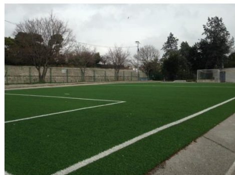
Sportsko igralište na Ravnicama

Projekt Sport i rekreacija invalidnih osoba obuhvatio je brojne projekte animacije i sportskog usmjeravanja osoba s invaliditetom, te treninge i natjecanja klubova osoba s invaliditetom, gluhih osoba i osoba s teškoćama u razvoju. Također, u 2015. godini pokrenut je besplatan program za umirovljenike „60+“ i odvija se u sklopu mjesnih odbora Grada Zadra.