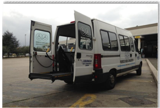
posebne usluge prijevoza za osobe s invaliditetom

Brojnim ciljanim projektima osobama s invaliditetom omogućena je cjelovita uključenost u društveni život zajednice. Tako se nastavilo sa financiranjem svih programa boravka djece u vrtiću za djecu s poteškoćama u razvoju, „Latica“, omogućen je besplatni javni prijevoz nepokretnih i teško