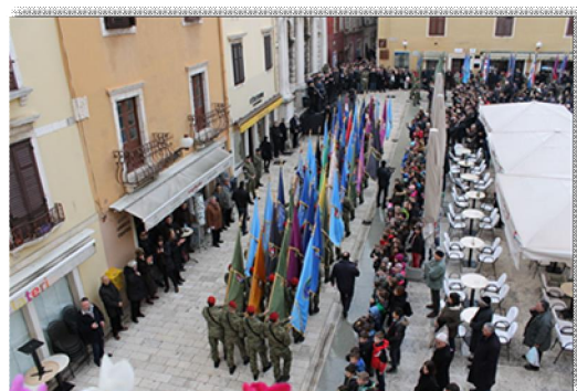
Obilježavanje VRO Maslenica

Programi pomoći hrvatskim braniteljima i afirmacije Domovinskog rata se uglavnom odnose na obilježavanje važnih obljetnica vezanih za stvaranje neovisnosti Republike hrvatske, obljetnica iz Domovinskog rata ili obljetnica osnutka pojedinih postrojbi, zatim prikupljanja dokumentacije i publiciranje knjiga iz naše najnovije povijesti i različitih vidova pomoći braniteljima. Važan dio pomoći provodi se na pružanje psihosocijalne pomoći hrvatskim braniteljima koju