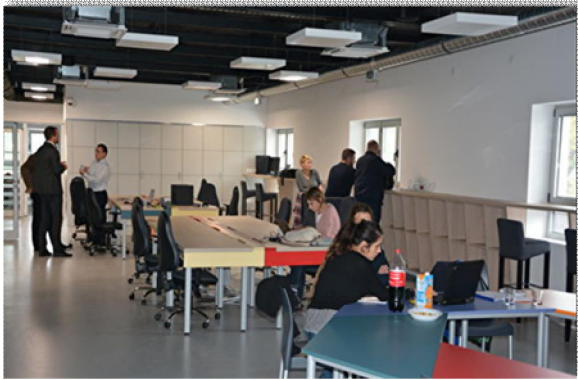
novootvoreni prostor COIN Zadar

se pristupilo pripremi novog postupka javne nabave za novog izvođača radova. Istodobno stvoreni su svi preduvjeti za pripremu javne nabave za