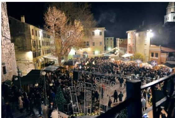
Advent u Zadru