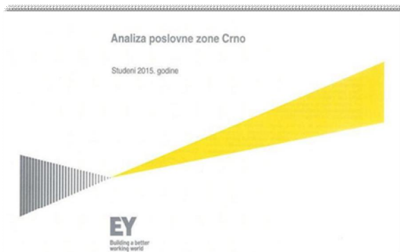
Dovršen dokument „Analiza poslovne zone Crno“

zahvata na okoliš, 20. srpnja 2015. nadležno Ministarstvo donijelo je rješenje da za građenje prometne i komunalne infrastrukture Gospodarske zone Crno nije potrebno provesti postupak procjene utjecaja na okoliš te da