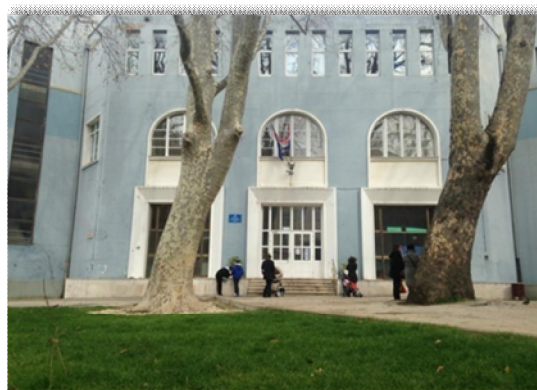
OŠ Petra Preradović spremna za energetske obnove

U programu Energetske obnove osnovnih škola, na Poziv Ministarstva graditeljstva i prostornog uređenja za Pilot projekt „Izrada projektne dokumentacije za energetske obnove zgrada i korištenje obnovljivih izvora energije u javnim ustanovama koje obavljaju djelatnost odgoja i obrazovanja“ za sredstva iz europskih fondova Prijavljene su OŠ Petra Preradovića i OŠ Smiljevac. Izrađen glavni i izvedbeni projekt energetske obnove zgrade OŠ Petra Preradovića i OŠ Smiljevac (za OŠ Petra Preradovića glavni i izvedbeni projekt će se još revidirati tijekom siječnja 2016. godine). U tijeku je izrada glavnog i izvedbenog projekta energetske obnove zgrade DV Vruljica, kao i Izrada glavnog projekta plinifikacije kotlovnice i sustava za solarnu pripremu PTV za ŠRC Ravnice.