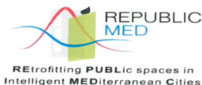
Slika5: Logo projekta „REPUBLIC MED“

Javna ustanova Agencija za razvoja Zadarske županije ZADRA NOVA nastavila je provedbu projekta pod nazivom REPUBLIC MED - RETrofittingPUBLIcspacesinIntelligentMEDiterraneanCiti eskoja je započela u travnju 2013. godine. Projekt se provodi u okviru transnacionalnog programa MEDITERAN, a vrijednost projekta je 15.387.364,24 kuna, dok je vrijednost na području Zadarske županije iznosi 1.178.596,07kuna. Provedba projekta traje do 30. lipnja 2015. godine.