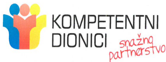
Slika 8: Logo projekta „Kompetentni dionici – snažno partnerstvo

Javna ustanova Agencija za razvoj Zadarske županije ZADRA NOVA u partnerstvu sa Zadarskom županijom i Hrvatskim zavodom za zapošljavanje – Područnim uredom Zadar provodi projekt Kompetentni dionici – snažno partnerstvo . Projekt je prijavljen i odobren na natječaju Lokalne inicijative za zapošljavanje – faza I. u sklopu Europskog socijalnog fonda te je 01. listopada 2013. godine počela provedba ovog projekta. Ukupno trajanje projekta je 20 mjeseci,