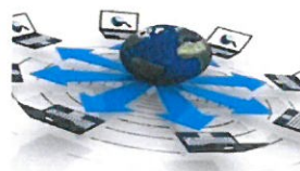
Slika 14: Logo projekta „I-CIA ofSMEs“

1.4.14 I-CIA of SMEsImprovingCompetitiveIntelligenceAbilitiesofSmallandMedium- Sized Enterprises