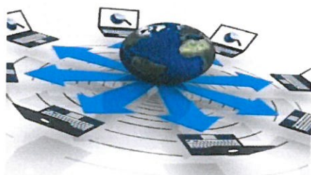
Slika 15: Logo projekta „I-CIA ofSMEs“

Projektom I-CIA ofSMEs , financiran sredstvima iz programa Leonardo Da Vinci - Transfer ofInnovationse razvijaju strukovni edukacijski treninzi kako bi se zaposlenicima malih i srednjih poduzetnika podigla razina osposobljenosti za konkurentnost na globalnom tržištu korištenjem suvremenih open i distance learning trening metoda. Javna ustanova Agencija za razvoj Zadarske županije ZADRA NOVA je partner na projektu, ostali projektni partneri su IDDMIB Udruženje (TR),LPK Latvijska konfederacija nevladinih udruženja (LT),Bogazici Sveučilište (TR), MERIG istraživački centar (AT),