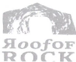
Slika 4 : Logo projekta „RoofofRock“

Projekt RoofofRock , punog naziva „ Vapnenac kao poveznica prirodne i kulturne baštine duž krškog dijela Jadranske obale “ prijavljen je i odobren u sklopu II. poziva Programa prekogranične suradnje IPA CBC Adriatic. Nositelj projekta je Geološki zavod Slovenije, a Javna ustanova Agencija za razvoj Zadarske županije ZADRA NOVA u projektu ima ulogu partnera. Uz Geološki zavod Slovenije i Javne ustanove Agencije za razvoj Zadarske županije ZADRU NOVU projekt ima još 8 partnera , od čega 3 iz Republike Hrvatske, 2 iz Slovenije, 2 iz Italije te 1 iz BiH.