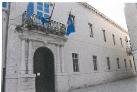
Slika 16: Kneževa palača, Zadar

Koordinator projekta je Javna ustanova Agencija za razvoj Zadarske županije ZADRA NOVA, nositelj projekta je Grad Zadar, a partneri su Narodni muzej Zadar, Turistička zajednica grada Zadra te Sveučilište u Zadru. Provedba projekta Obnova i turistička valorizacija kulturno povijesnog kompleksa Kneževa palače odobrenog za financiranje na natječaju za razvoj poslovne infrastrukture, iz Operativnog programa Regionalna konkurentnost 2007.—2013., započela