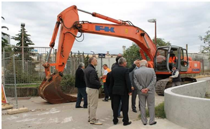
Radovi na kanalizacijskoj mreži

U izvještajnom razdoblju, među značajnijim poslovima na izradi projektne dokumentacije za izgradnju nove komunalne infrastrukture, vrijedi istaknuti završetak projekata rekonstrukcije i izgradnje Ulice Petra Skoka i Marina Getaldića te Ulice Hrvoja Čustića, kao i onih za izgradnju društvenih zgrada u mjesnim odborima Vidikovac i Plovanija koji uključuju i uređenje tamošnjih dječjih igrališta.