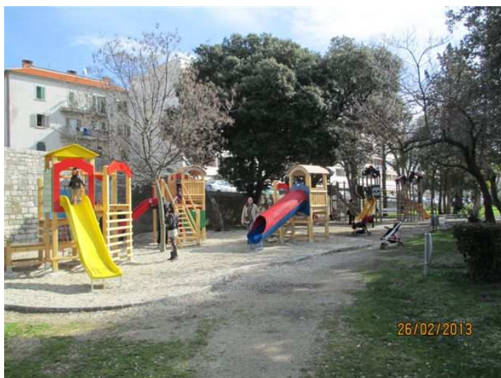
Dječje igralište na Novoj rivi

Na području osam mjesnih odbora postavljena je nova javna rasvjeta, a nabavljena je i postavljena nova komunalna oprema ( autobusne čekaonice, ograde za zaštitu zelenih površina, parkovne klupe, pragovi za smirivanje prometa ) na više gradskih lokacija.