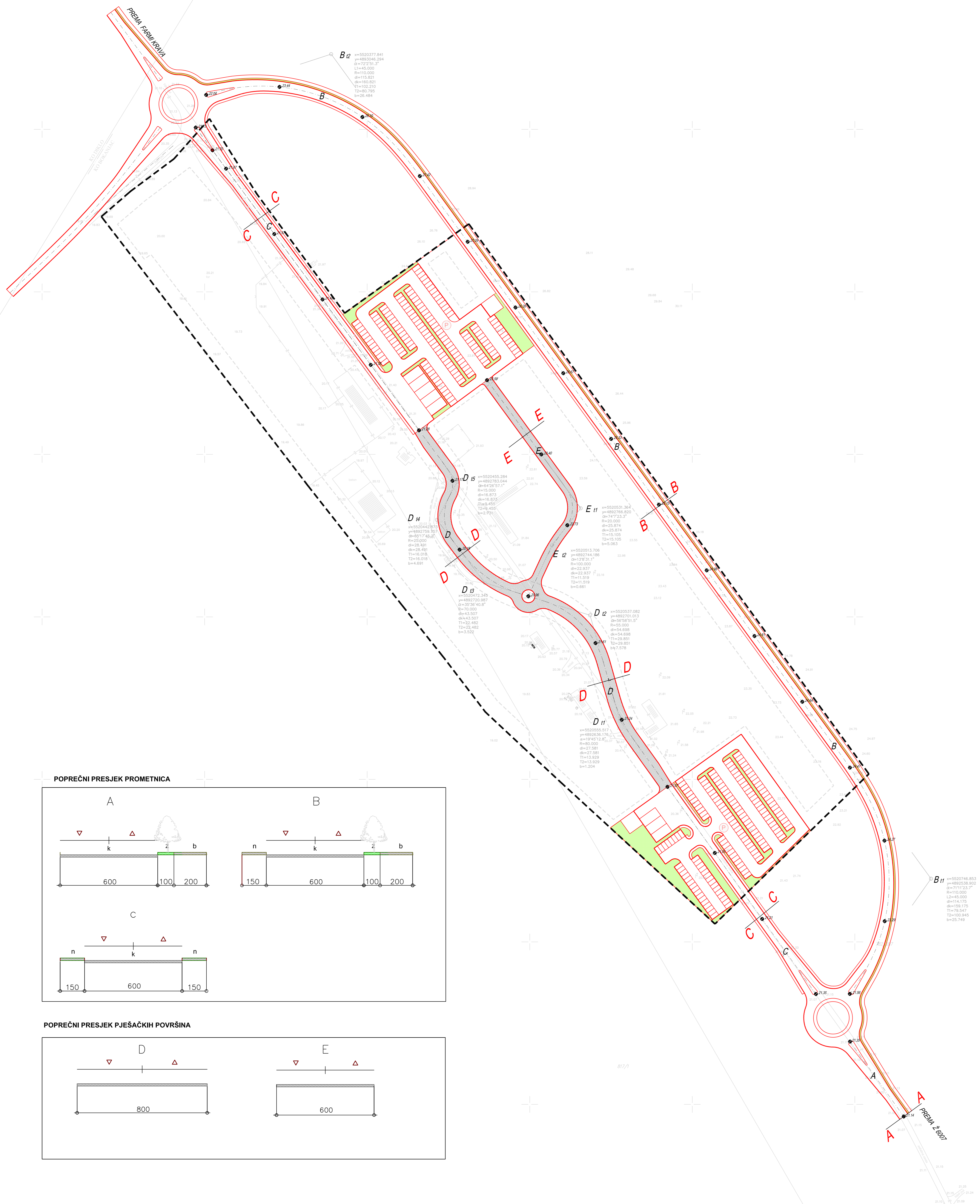
POPREČNI PRESJEK PROMETNICA