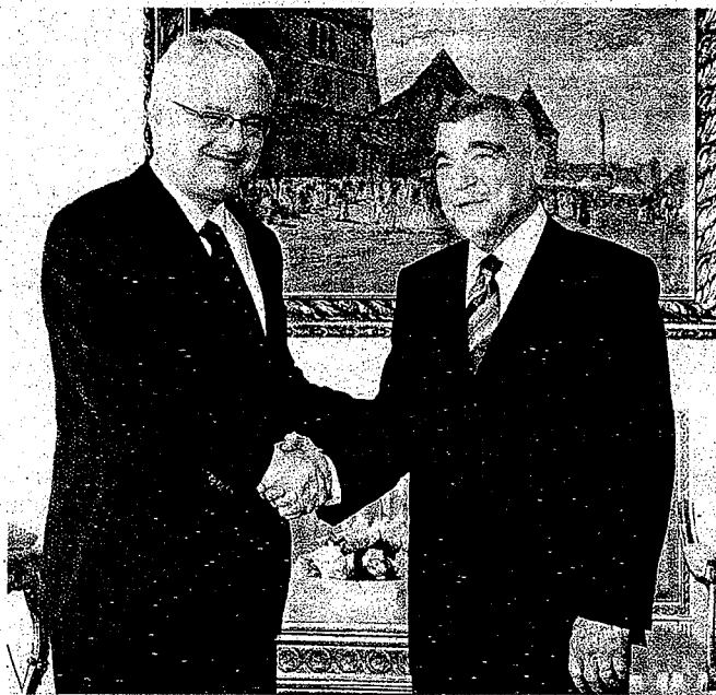
Uz Ured predsjednika Hrvatska ima i Ured bivšeg predsjednika. Do kada će sve to hrvatski porezni obveznici trpjeti?

Istovremeno u siromašnoj, neuređenoj i rastrošnoj RH, pravila ponašanja su savim suprotna. Zbog toga državna uprava nije ni djelotvorna, ni jeftina, ali je vrlo rastrošna. Držim da se to najbolje vidi u funkciji predsjednika RH, koji praktički nema nikakve konkretne uloge u svakodnevnom funkcioniranju države. On ustvari ima počasne fun-